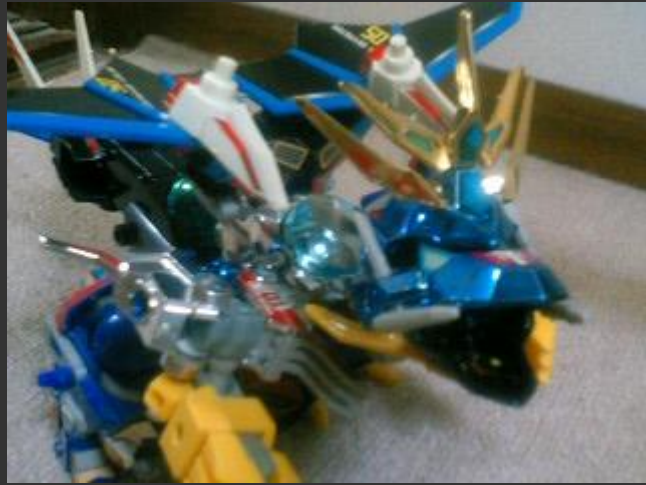
敵はセイント・ドラゴン。