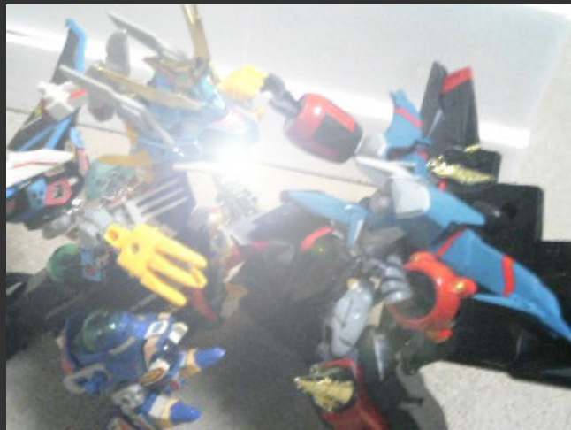
ドラゴンが光弾を放ち、仰け反るガオファイガー！